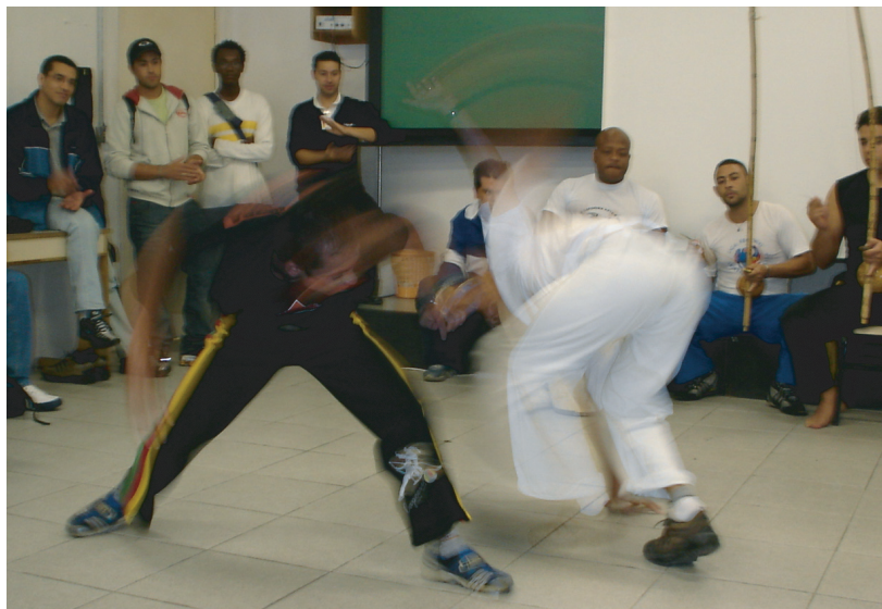
Os alunos da turma da manhã assistiram à apresentação do jogo da capoeira

Uma série de palestras abordando temas variados, incluindo uma roda de capoeira, marcou a Nona Semana de Engenharia, realizada nos dias 24 e 25 de agosto.