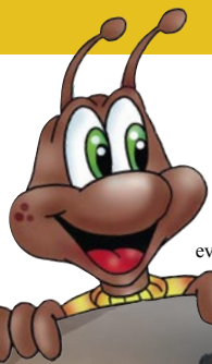
Formiga Soli, mascote do evento