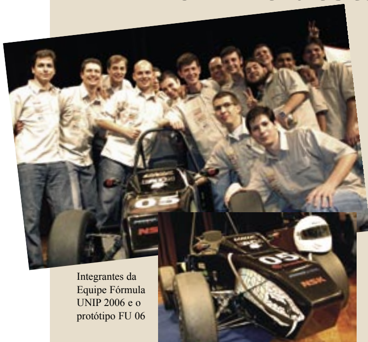
Integrantes da Equipe Fórmula UNIP 2006 e o protótipo FU 06

Os alunos do segundo ao nono semestres de Engenharia ( campus Indianópolis), integrantes da Equipe Fórmula UNIP 2006, destacaram-se, entre mais nove equipes de cinco Estados, do Distrito Federal e da Venezuela, na disputa da terceira edição da competição Fórmula SAE Brasil 2006 (Society of Automotive Engineers), realizada na Base Aérea de Campo dos Afonsos, Rio de Janeiro.