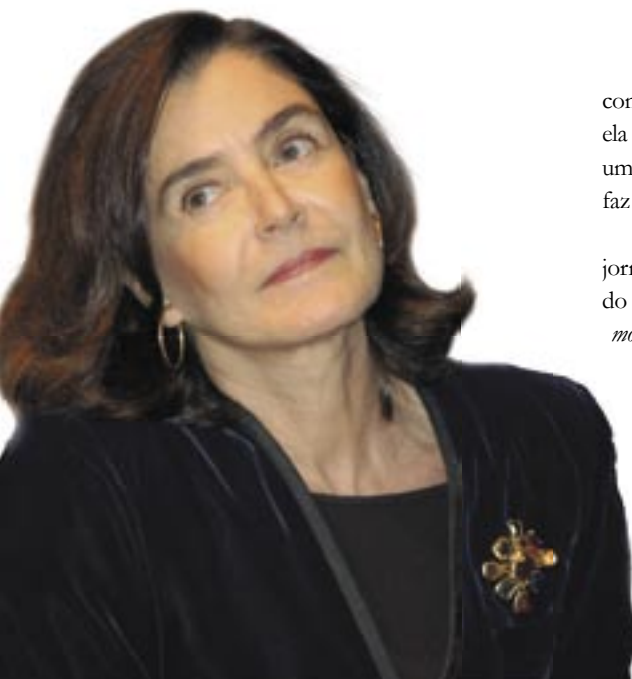
Jornalista Glória Kalil

“A moda deixou de ser única e passou a ser múltipla, porque cada tribo tem a sua oferta de moda diferente. Hoje, a moda expressa a nossa personalidade.”