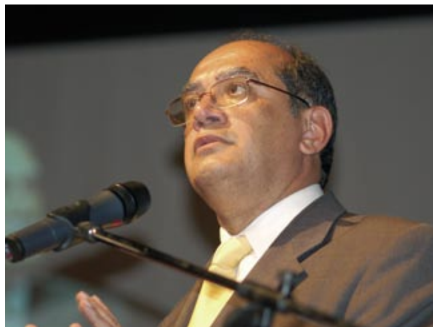
Vice-presidente do Supremo Tribunal Federal, Gilmar Mendes

O ministro afirmou que, para fortalecer as instituições, é importante a eleição democrática, das casas de representação popular. O modelo adotado para a Câmara dos Deputados é o voto proporcional, em que o partido indica seus candidatos e tem de ultrapassar o coeficiente eleitoral, que traduz o índice de votos a ser obtido para distribuição das vagas. É mediante a divisão de votos