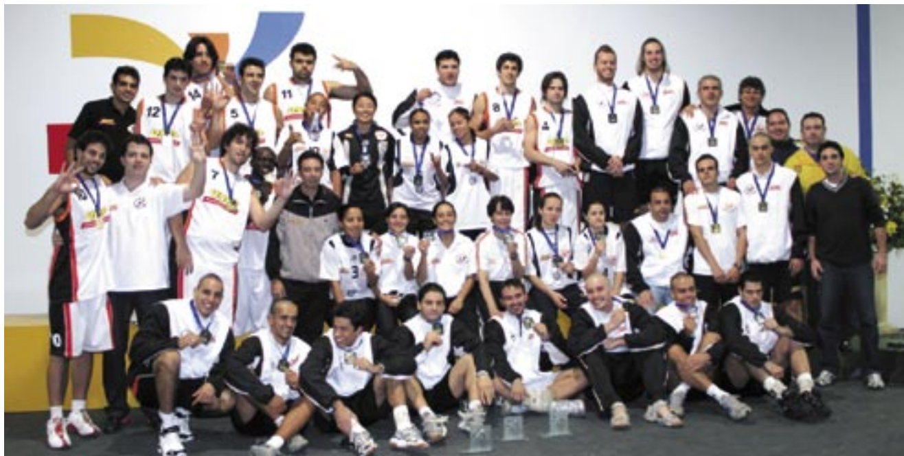
Atletas da equipe de basquete, vôlei e futsal

A Universidade Paulista conquistou o tricampeonato nas Olimpíadas Universitárias – JUBs 2007, realizadas em Blumenau – Santa Catarina.