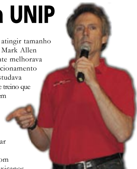
Triatleta Mark Allen

Após sua aposentadoria, decretada oficialmente em 1995, Mark treina novos esportistas. Sua concepção é de que um atleta deve ter sua formação esportiva definida desde criança, pois pode condicionar o corpo a obter melhores resultados. Além disso, acredita que, para extrair todo o potencial e ser um vencedor, o atleta tem de manter seu físico em equilíbrio com sua mente. “Para atingir o melhor desempenho em uma prova, não basta apenas que o competidor treine exaustivamente, o que realmente vale é condicionar seu corpo e seu psicológico a manter um nível elevado de desempenho.” ■