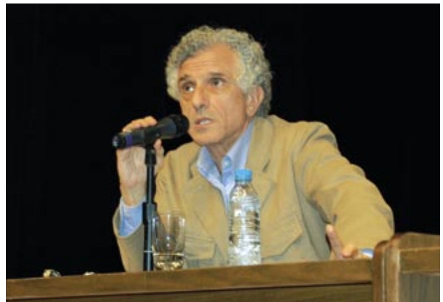
Psicanalista Contardo Calligaris

até do discurso marxista em relação à normalidade, Calligaris finalizou afirmando que todos podem ser corrigidos, terapeutizados e educados. A Psicologia, sem dúvida, tem grande papel nisso. ■