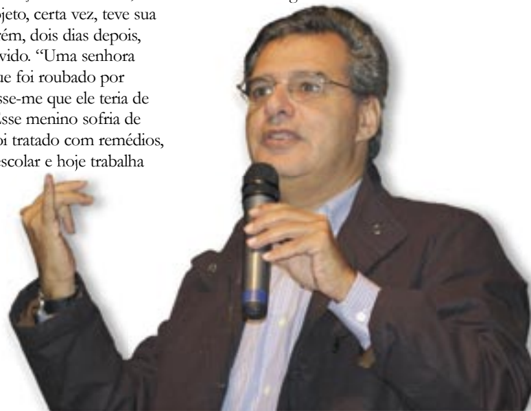
Jornalista Gilberto Dimenstein

Aquele menino que quase morreu afogado era Winston Churchill, que veio a ser o mais importante estadista do seu tempo. Muitos anos se passaram e Churchill contraiu uma gravíssima infecção que, na época, não tinha cura. Entretanto, havia um cientista com um novo experimento, porém nunca testado em seres humanos. Churchill arriscou e ficou curado: o novo medicamento era a penicilina, criada pelo escocês Alexander Fleming, o rapaz que o salvara do afogamento na infância. ■