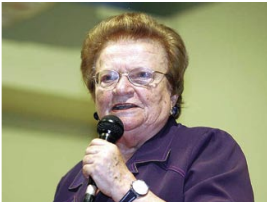
Deputada federal Luiza Erundina

Em visita ao campus , a deputada federal Luiza Erundina aproveitou para ministrar a palestra A Mulher .