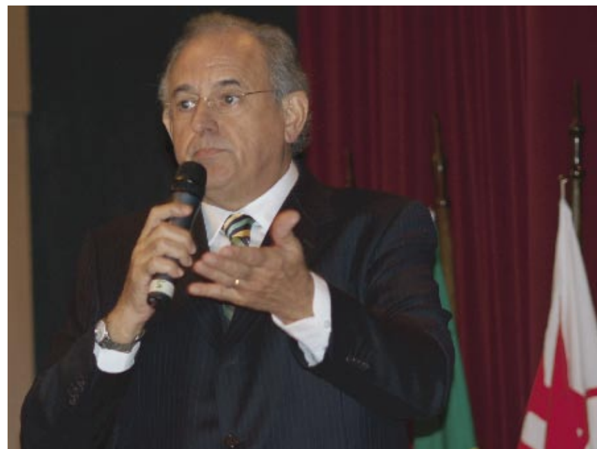
Presidente do Supremo Tribunal Federal, Nelson Jobim

Para encerrar, Nelson Jobim salientou que, apesar do seu pouco tempo, o Conselho está sabendo enfrentar, de maneira progressiva, as definições importantes, como a conciliação entre a sua função convencional de julgar disciplinarmente a magistratura nacional nos casos submetidos ao Conselho com a sua função de planejamento e fiscalização. “O Conselho Nacional de Justiça deseja estabelecer critérios para que os tribunais brasileiros sejam confiáveis, acessíveis a todos e previsíveis”, completou. ■