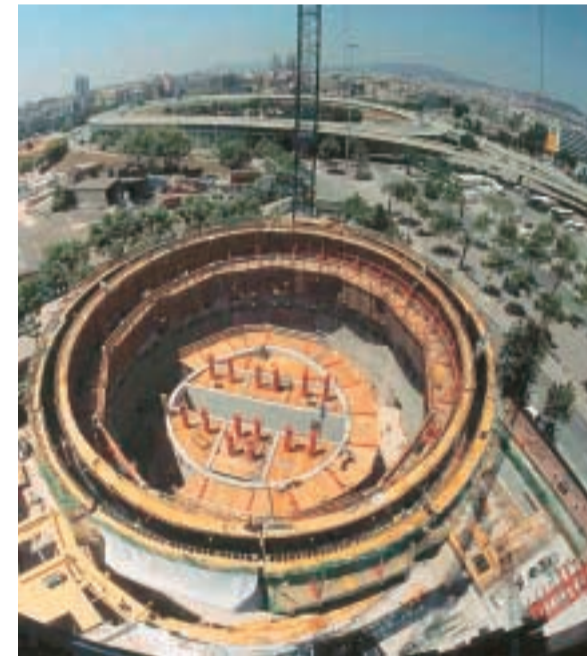
Ao lado e acima, Agbar – interno e implantação; abaixo, duas paisagens de Santana.