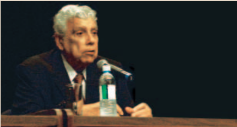
Antônio Ermírio de Moraes, em palestra pelo Sistema Multiensino

O empresário Antônio Ermírio de Moraes, presidente do conselho de administração do Grupo Votorantim, o maior entre os privados do País, fez conferência pelo Sistema Multiensino , e se deteve em questões como crescimento sustentado, criação de empregos, impacto das reformas na economia, “risco-país”, taxa Selic , alimentos transgênicos etc. O palestrante também discutiu o futuro da nossa matriz energética, a Alca e o posicionamento do Brasil no mundo. Segundo o empresário, o binômio educação e agricultura é fundamental para a geração de novos empregos.