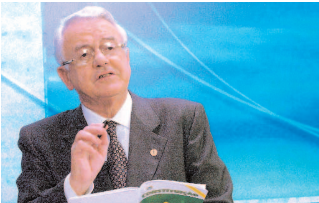
Ministro Carlos Velloso explica o recurso extraordinário

porém, com o surgimento da nova Carta Magna, tal missão passou a pertencer ao Superior Tribunal de Justiça (STJ). Desde então, o Supremo é o guardião da Constituição Federal, função que cumpre pelas vias concentrada e difusa.