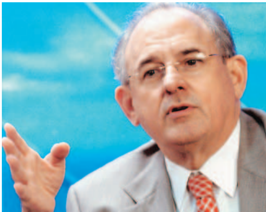
Palestra do ministro Nelson Jobim foi acompanhada em tempo real por canais de TV e pela internet

O ministro espera que a arbitragem possa, com o tempo, diminuir a demanda de ações atualmente submetidas à apreciação do Judiciário. Resta, segundo ele, que as câmaras arbitrais adquiram confiabilidade, mostrem-se aptas a proferir decisões justas e rápidas. ■