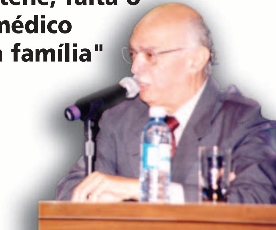
Segundo Adib Jatene, o médico precisa saber "ouvir" o paciente

Fazer um diagnóstico da saúde no Brasil é tarefa para especialista. E ninguém melhor para cumpri-la que o médico e cientista Adib Jatene, que se dispôs a debater o tema na palestra que realizou pelo Sistema Multiensino .