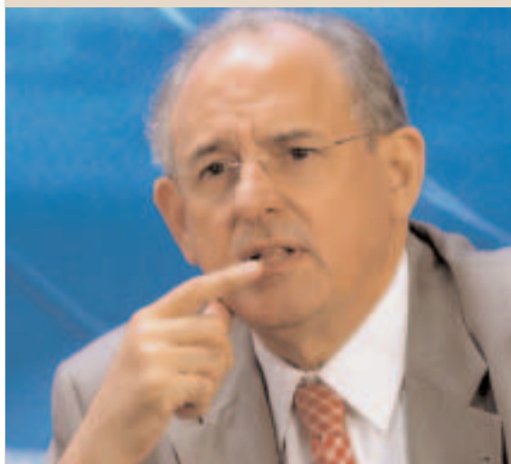
Ministro Nelson Jobim explica as formas de litisconsórcio

Litisconsórcio. Nome que define a pluralidade de partes agrupadas no mesmo pólo de uma relação processual. Esse foi o tema escolhido pelo ministro Nelson Jobim, vice-presidente do Supremo Tribunal Federal (STF), na palestra que concedeu, a partir de Brasília, pelo Sistema Multiensino . Distante geograficamente, a platéia acompanhou a conferência por meio da internet e dos canais da TV RBI (Rede Brasileira de Informação), em São Paulo e Brasília.