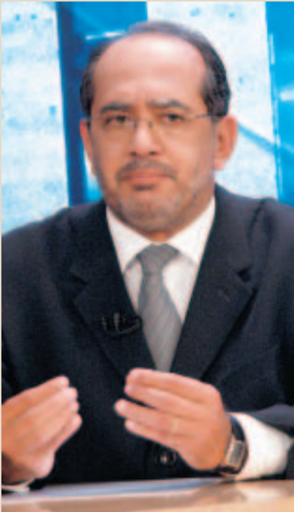
Ministro Gilmar Mendes, na palestra sobre controle de constitucionalidade