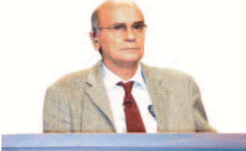
Drauzio Varella, no debate sobre violência urbana

No Teatro Bacelar , da UNIP, foi realizado o sétimo de nove programas da série SP 450 anos/A Paulicéia em debate . O tema foi “Violência urbana”.